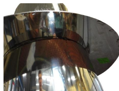
U límce bez instalovaného těsnění byly nalezeny kapky vody. Límec instalovaný bez dodatečného silikonu není 100% těsný. Nelze vyloučit průnik minimálního množství vody. Vždy utěsněte!