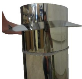
5. Silikon naneste rovnoměrně a v dostatečném množství. Silikon musí být vhodný pro venkovní použití