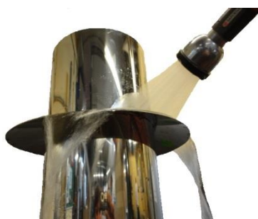
Pod límcem silikonového těsnění, nebyly po testu žádné stopy po vodě.

Zkouška odolnosti proti zatékání se silikonovým těsněním a bez něj: