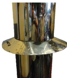
10 minutový test s a bez silikonového těsnění