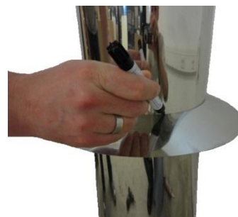
3. Označte si polohu límce