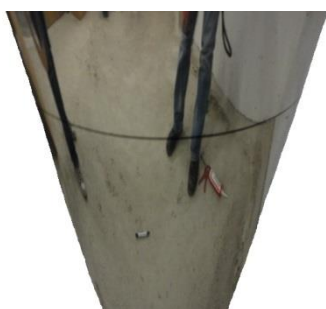
4. Naneste silikon na označené místo (U jednovrstvých výfukových systémů musí být použito silikonového materiálu odolného vůči vysokým teplotám)